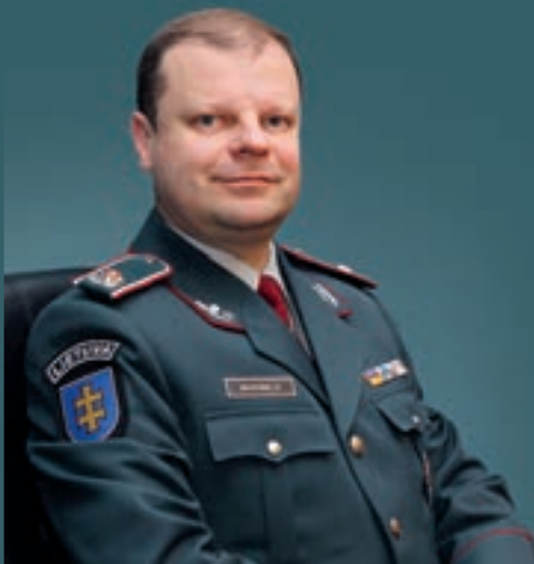
Saulius Skvernelis Policijos generalinis komisaras Police Commissioner General

Lietuvos policija, gimusi sunkiais mūsų valstybei laikais, nuo pat pirmų dienų tapo patikima savo krašto, jo žmonių gynėja. Ji brendo, augo ir stiprėjo kartu su visa tauta, kartu su ja siekė laisvės ir šiandien yra pasiryžusi apginti kiekvieną žmogų.